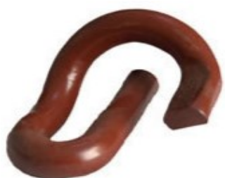
Grampo elástico tipo S

para Ferrovias em aço carbono SAE-9254 ou equivalente. Dureza 44-48 HRC.