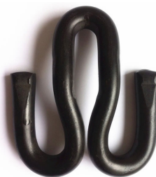
Grampo elástico tipo W – Fast clip